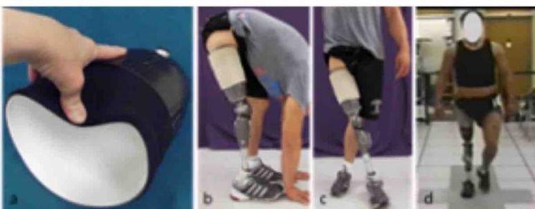
Pressure sensitive and pressure tolerant areas of the TF stump

Lo sviluppo di una presa subschiatale più confortevole e possibilmente funzionale può contribuire a migliorare la qualità della vita delle persone con amputazione transfemorale.